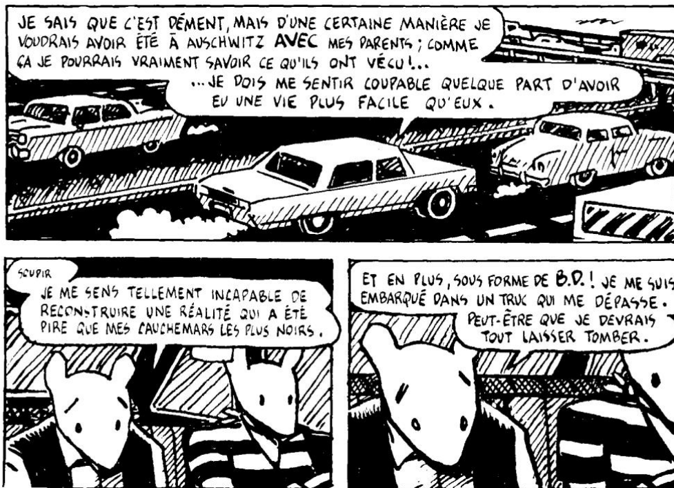
Maus—Art Spiegelman, tome 2 p. 16

Traduit et publié dans plus de trente langues, vendu à plusieurs millions d'exemplaires, c'est le seul album de bande dessinée au monde à avoir obtenu un prix Pulitzer. Maus a été. La notoriété et les très nombreuses demandes d'explication au sujet de l'œuvre ont conduit Spiegelman à publier MetaMaus (Flammarion, 2012), ouvrage dans lequel l'auteur répond aux invariables questions posées par les lecteurs : Pourquoi la BD ? Pourquoi des souris ? Pourquoi l'Holocauste ? et où il porte un nouveau regard sur son œuvre à travers un passionnant dialogue avec Hillary Chute.