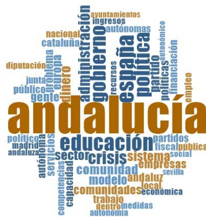
Figure 1: Résultats de l'analyse NVivo pour le panel de l'Andalousie

Le nuage de mots montre l'importance de la « région » comme niveau pertinent du discours des acteurs. Il souligne également le poids de la vie partisane : la concurrence politique entre le Parti populaire (PP) et le Parti socialiste (PSOE) est fréquemment présentée par les acteurs comme une composante importante de la gouvernance territoriale. Le contexte de crise économique ressort assez logiquement, manifesté par une inquiétude autour de ressources financières insuffisantes et de la hausse du chômage. Ces résultats sont conformes à la vision classique de l'Andalousie comme une région économiquement sous tension, marquée par une division partisane et un fort ressentiment vis à vis de Madrid, mais disposant d'une administration territoriale robuste et orientée en faveur de l'Europe. Les entretiens montrent qu'en réponse à la crise, le modèle territorial se durcit ; de même, le modèle de social-démocratie « à la méditerranéenne », défini comme un rejet du néo libéralisme associé au gouvernement central de Madrid, se renforce. L'Andalousie se présentant en somme comme le dernier rempart contre le néo libéralisme.