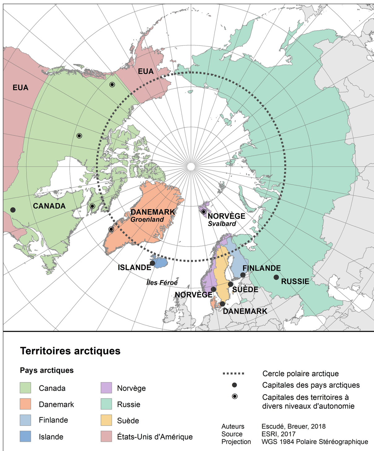
Figure 1. Les territoires arctiques (Escudé, Breuer, 2018)

Il rassemble toutes les organisations de populations autochtones représentées au sein du Conseil de l'Arctique.