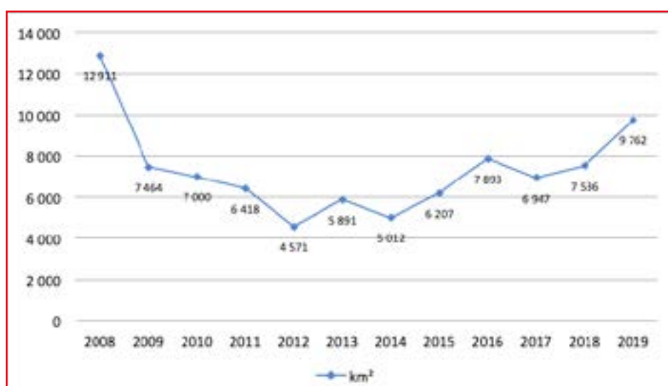
Figure 3 Evolution des surfaces de déforestation en Amazonie brésilienne entre 2008 et 2019 (km 2 )

La tendance est pourtant repartie en sens inverse à la fin du gouvernement de Dilma Rousseff (destituée en 2016 après plusieurs mois de crise politique), puis sous la présidence de Michel Temer, avec une moyenne de 7 459 km 2 par an entre 2016 et 2018. L'arrivée au pouvoir de Bolsonaro semble marquer un nouvel élan destructeur et passer l'accord de Paris au rouleau compresseur (Figure 3). Et les satellites utilisés dans le cadre du programme Prodes (Landsat 8 OLI, CBERS 4, IRS-2) ne repèrent et ne comptabilisent que les zones de déforestation supérieures à 6,25 hectares 16 . Les surfaces de forêt amazonienne dégradées ne sont pas non plus comptabilisées. Les niveaux réels de déforestation et de dégradation de l'Amazonie brésilienne sont donc encore bien plus inquiétants que ce que les indicateurs publiés par l'INPE laissent apparaître.