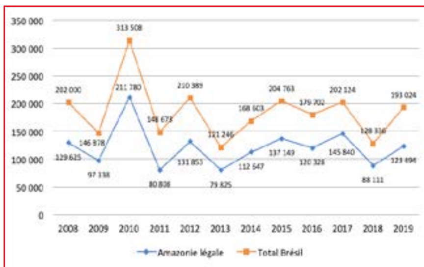
Figure 1 Evolution du nombre de départs d'incendies en Amazonie brésilienne et dans l'ensemble du Brésil entre 2008 et 2019