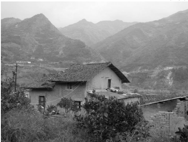
Maisons traditionnelles en pisé (Préfecture de Kaixian) dans un paysage montagneux typique de la région