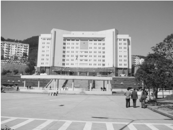
Artère principale de la ville nouvelle de Zigui (au fond : le siège du gouvernement)