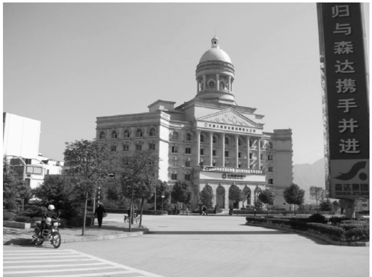
L'une des banques de la ville nouvelle de Zigui