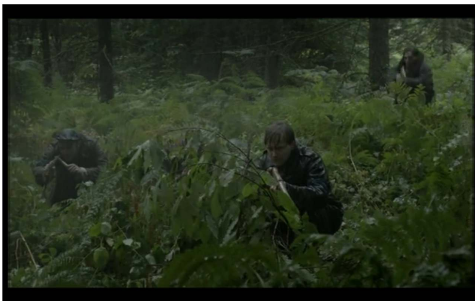
Figure 1 : « L'entraînement du maquis sous la pluie » (Épisode 5.4, 1'14)