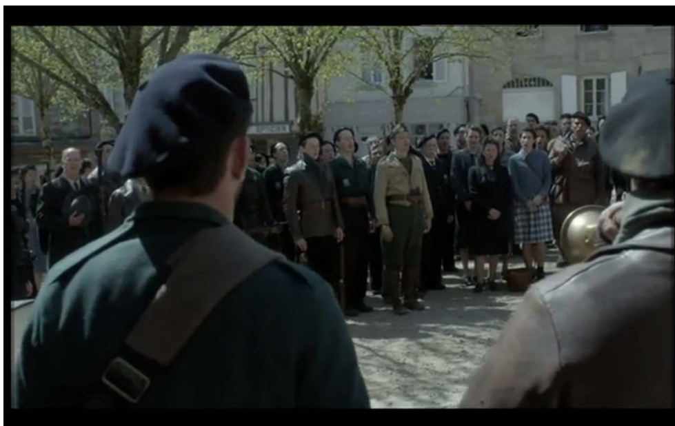
Figure 4 : Épisode 5.10, 36'00 : « La Marseillaise devant le monument aux morts »