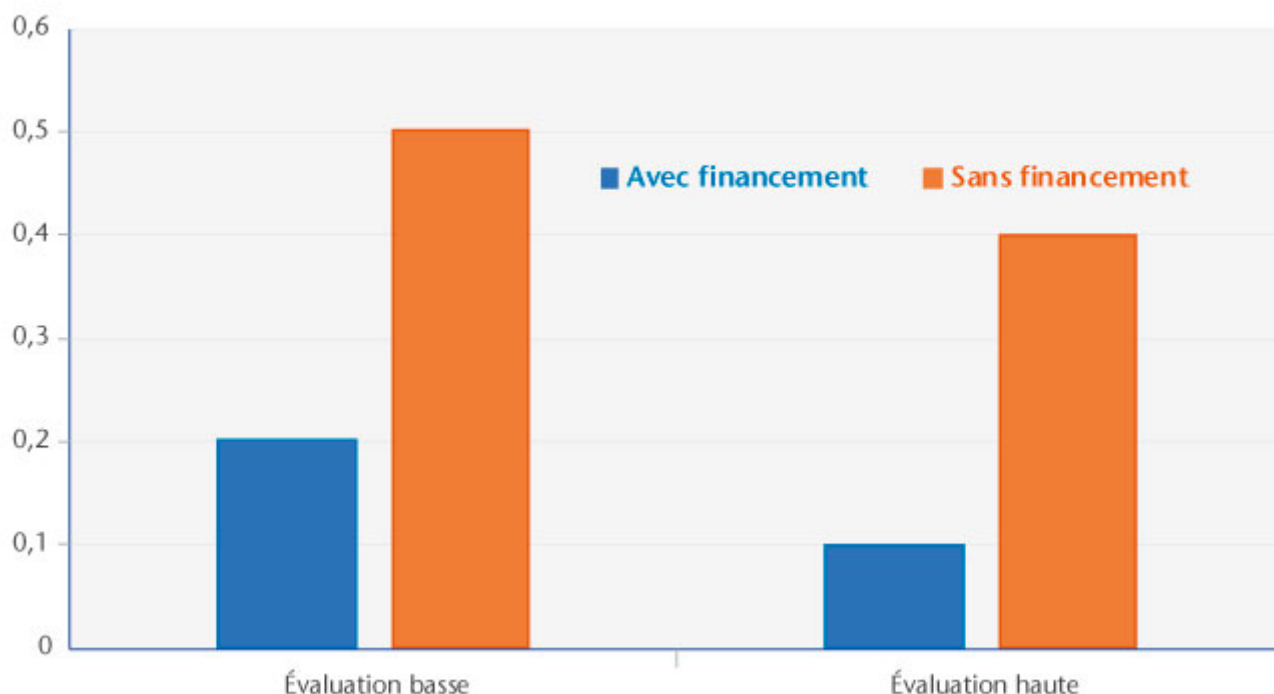
Graphique 3. Contribution du CICE au PIB en fin de période, en écart au compte central

Le graphique 2 apporte des informations complémentaires et montre que les effets relatifs au financement du CICE (fiscalité, économies de dépenses publiques) sont importants et contribuent à limiter l'efficacité du dispositif. Les effets du financement étant constants dans les deux évaluations, l'impact du CICE sur le comportement des entreprises en termes de demande de travail est déterminant pour obtenir un effet « net » important sur l'emploi. Autrement dit, les effets d'offre doivent être rapides pour compenser l'impact négatif du financement sur la demande intérieure. Il faut ajouter que les simulations ne prennent en compte qu'un tiers des économies de dépenses publiques, en raison de la disponibilité limitée des données fournies par le TEPP (2013-2015). Par conséquent, le coût du CICE n'est pas totalement couvert dans nos simulations, d'où une impulsion budgétaire positive. Si nous avions pu prolonger nos simulations, les effets négatifs du financement auraient probablement été plus importants.