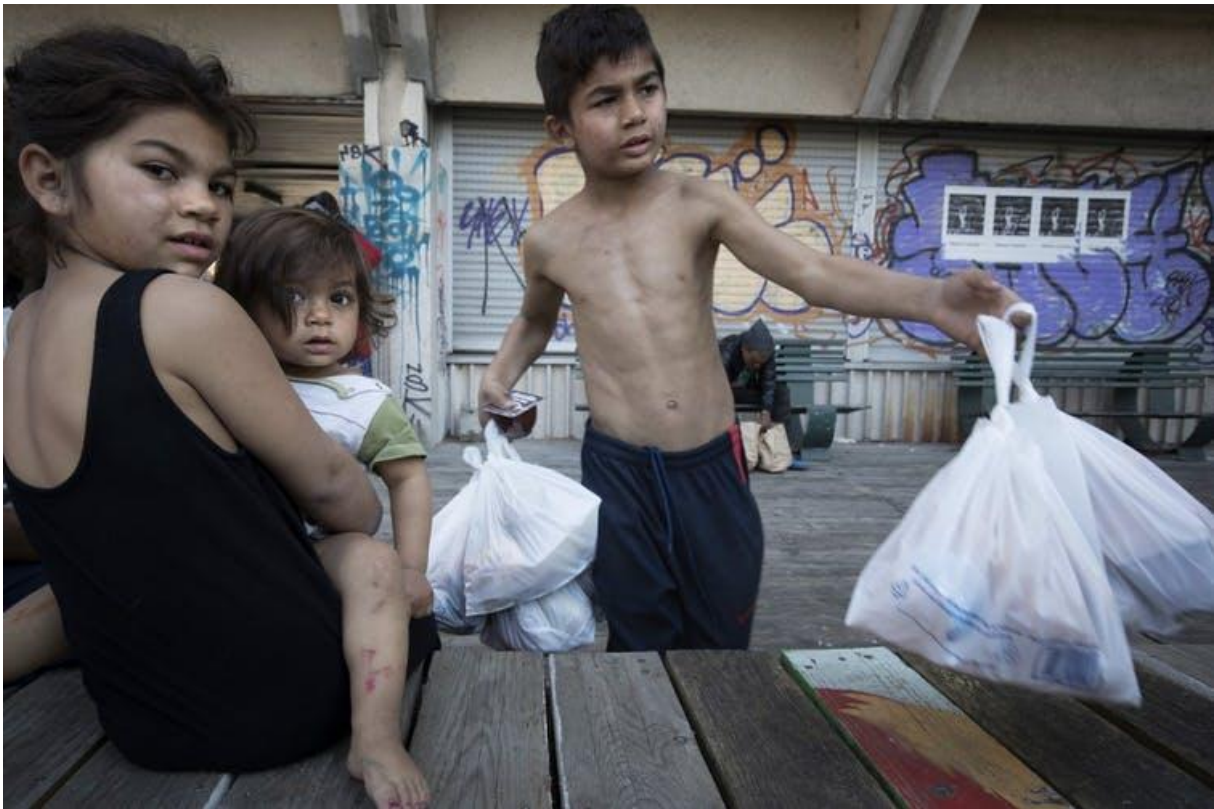
Des enfants de la communauté des Roms emportent des sacs de nourritures distribués par l'association caritative, l'Armée du Salut, à Paris le 9 avril 2020.

Si les aides deviennent plus difficiles d'accès, cette mise en concurrence de la pauvreté peut conduire à des discours de rejet voire à des actes de violence 3 . Ces derniers sont déjà identifiés dans un contexte où les comportements ou actes racistes et xénophobes envers des personnes identifiées comme Roms persistent et les réactions de la police ne sont pas toujours immédiates 4 .