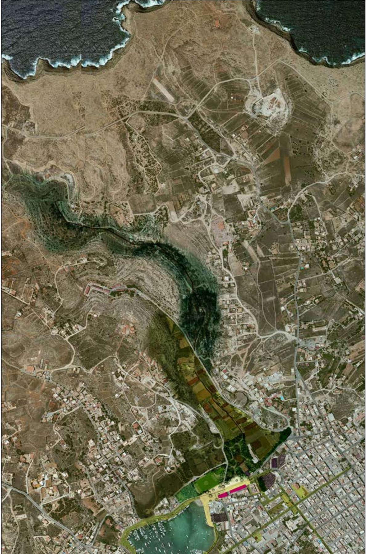
5. Schema del progetto strutturante 'la valle verde'