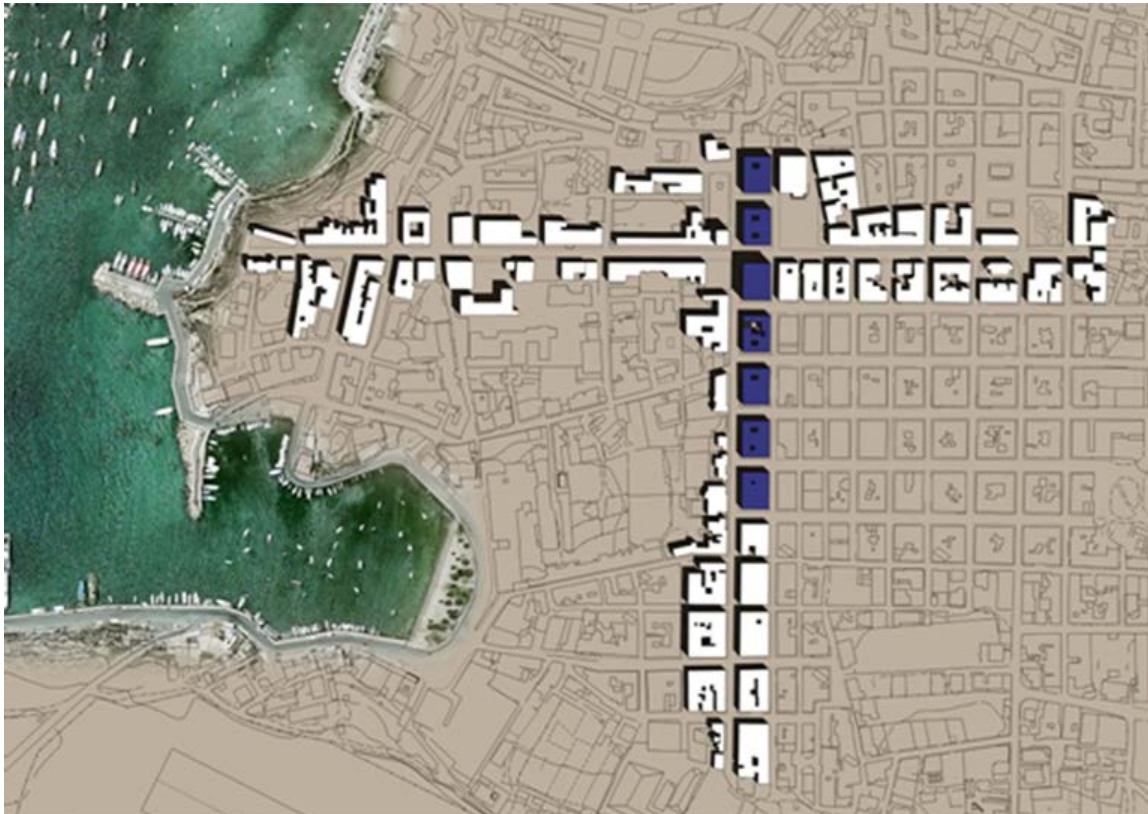
8. Morfologia dell'abitato: schema dei 'sette palazzi' originari