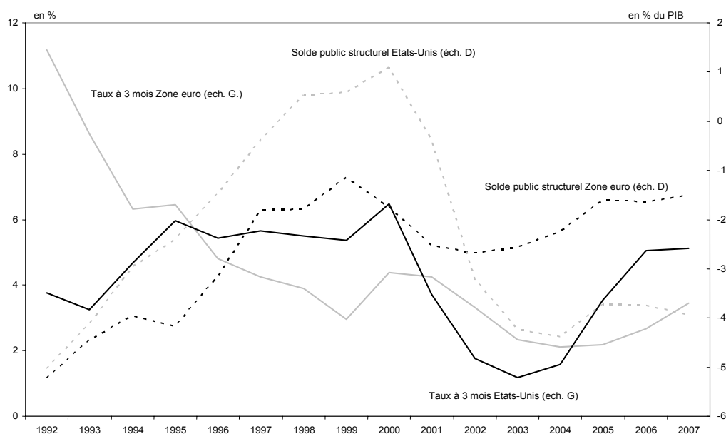
Graphique 2. Politique monétaire et budgétaire aux Etats-Unis et dans la zone euro

Cependant, les Etats-Unis ont, malgré la multitude de chocs subis, su éviter une récession majeure et sont parvenus à maintenir une croissance à 2% grâce à une politique économique très volontariste : la Réserve fédérale américaine (Fed) a en effet baissé ses taux directeurs de près de 5 points entre 2000 et 2002 et l'impulsion budgétaire a représenté quasiment 4,5 points de PIB (graphique 2). L'Europe a bien sûr également été touchée par l'explosion de la bulle Internet, mais l'ampleur du choc a été de moindre ampleur, et elle n'a pas eu à faire face à des attaques terroristes et des scandales financiers comparables. Enfin la suraccumulation de capital opérée aux Etats-Unis pendant la deuxième moitié des années 1990 ayant été beaucoup plus forte qu'en Europe, l'ajustement opéré pendant la période post-bulle par les entreprises sur l'investissement a été beaucoup plus drastique aux Etats-Unis que de l'autre côté de l'Atlantique. Au final, l'Europe a été plus préservée que les Etats-Unis du retournement financier mondial, ces derniers subissant de plein fouet les modifications du comportement des investisseurs. Si l'écart entre les deux zones ne s'est pas plus creusé à ce moment là, c'est en grande partie lié au policy mix européen beaucoup plus mou que celui américain.