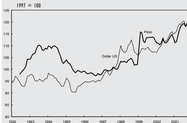
GRAPHIQUE 2 : TAUX DE CHANGE EFFECTIF RÉEL DU PESO ET DU DOLLAR US