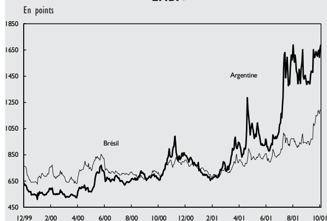
GRAPHIQUE 3 : INDICE RISQUE-PAYS* POUR L'ARGENTINE ET LE BRÉSIL

A la fin de l'année 2000, le pays semblant incapable de retrouver le chemin de la croissance et de restaurer sa solvabilité, la crise de confiance réapparaît (graphique 3). Les investisseurs craignent à nouveau un défaut de paiement sur les 21,8 milliards de dollar d'engagements du gouvernement fédéral pour l'année 2001. Cette fois, la communauté internationale se mobilise et débloque, sous l'égide du FMI, un prêt d'urgence de 39,7 milliards de dollar, conditionné à un nouveau programme d'ajustement des finances publiques.