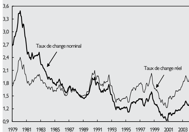
GRAPHIQUE 2 : TAUX DE CHANGE EFFECTIF DE L'EURO