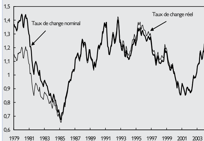
GRAPHIQUE 1 : TAUX DE CHANGE EURO/DOLLAR