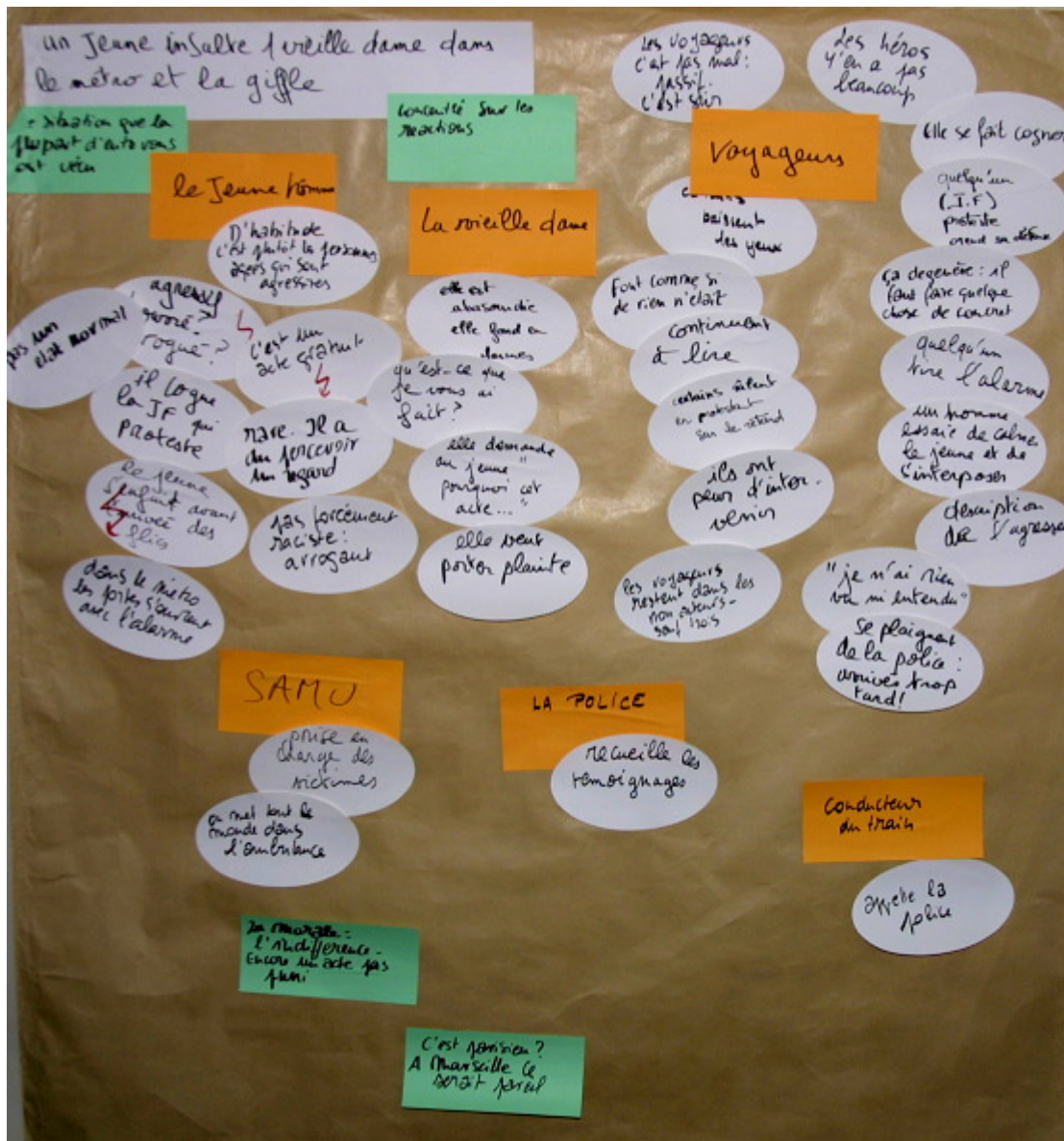
3/ Groupe des employés